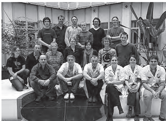
Myeloomonderzoeksgroep van het UMCU in 2010

effectiever te maken. Hier valt bijvoorbeeld onder het vaccineren met tumoreiwitten om de afweer van de patiënt sterker en specifiek te maken. Een dag in de week heb ik vrijgehouden voor onderzoek. Dat betekent het bespreken en plannen van het onderzoek van de verschillende promovendi van de myeloomonderzoeksgroep.